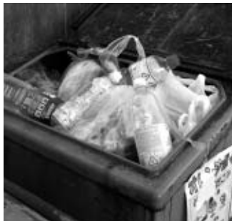
▲適正排出がリサイクルの第一歩です