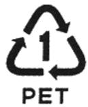
▲ペットボトルの識別マーク

市では、平成16年から10年間でごみを50%減量することを目指し、市民・事業者・行政が一体となった「1万トンごみ減量大作戦」を展開しています。その一環として、ごみの分別収集や資源の再資源化を行っています。不燃ごみの中には多くのペットボトルが混入して、貴重な資源がごみとして処理されています。