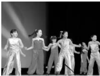
▲活動の成果をご覧ください

▽入場 自由(無料) ▽問合せ 府中ちびっ子ふれあい文化祭実行委員会事務局(365・6211 = 是政文化センター)