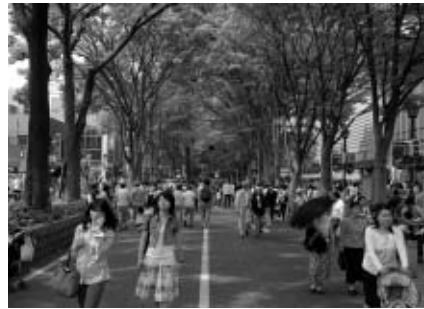
▲市のシンボルを次世代に

市では、「馬場大門のケヤキ並木」の保護の取組みを紹介し、市民の皆さんにけやき並木への理解を深めていただくため、「ケヤキ並木紹介コーナー」を開設しました。 けやき並木について、写真や解説パネルなどを使いわかりやすく展示していますので、ぜひ、ご覧ください。 ▽開設日時 月曜から金曜日の午前10時~午後4時/ただし、祝日を除く ▽場所 府中駅北第2庁舎1階 ▽入場 自由(無料)