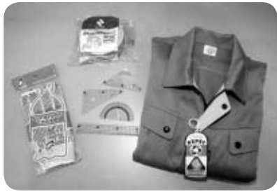
▲ペットボトルの再生品

に再生されています。リサイクルの輪をつなげるために、再生品を積極的に使用しましょう。