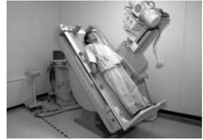
▲自身の健康管理に