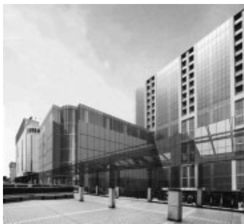
▲府中駅南口A地区再開発の完成予想図

府中駅南口A地区再開発の事業化に向けて準備組合への支援を行うとともに、南武線西府駅の整備とその周辺のまちづくりに向けて西府土地区画整理事業を推進します。また、交通バリアフリー特定事業計画に沿って市道を整備するとともに、みちづくりバリアフリー化整備を計画的に進めます。