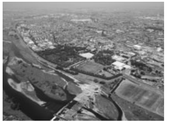
▲水と緑の拠点「郷土の森公園」

●観光名所づくりを目指して、郷土の森博物館総合体育館周辺区域を「郷土の森公園」と名付け、水と緑に親しめるまちづくりを進めます ●緑化…生け垣造成や指定樹木への奨励金制度の利用促進に努めるとともに、公園などの整備や緑地の保全に取り組み、人と自然が共生する緑ゆたかなまちづくりを進めます