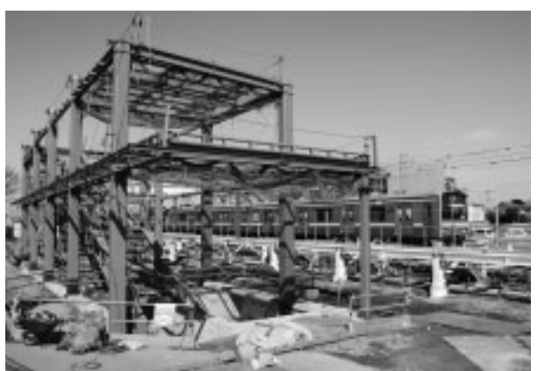
▲平成21年3月の開業に向け工事が進む西府駅