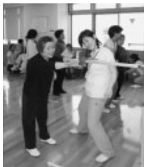
◀元気で自立した生活ができるように