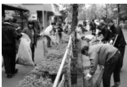
▶一人ひとりの手できれいなまちを

市民参加の環境フェスタを開催し、環境問題に対する意識啓発を行います。さらに、環境美化協定を自治会、商店会、企業などと締結し、協働で環境美化を推進します。