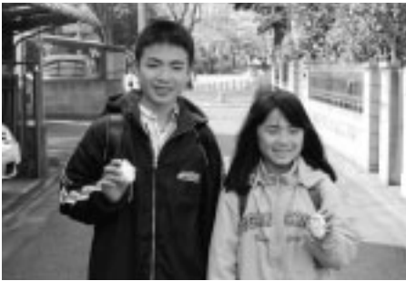
▲小学生の安全な登下校のために