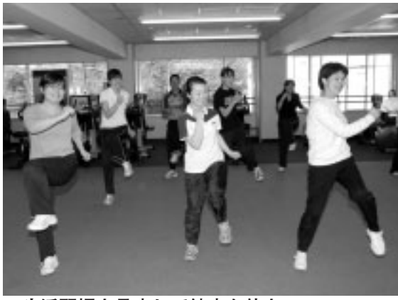
▲生活習慣を見直して健康な体を

●保育所の待機児解消…三本木保育所の定員増に向けた増改築事業を推進するとともに、民間保育園開設に向けた施設整備費の助成などを行います。また、新たに認証保育所と保育室の利用者に、保育料の一部を助成して負担軽減を図ります ●学童クラブ事業…地域住民や関係団体との連携を深め、安心して子どもを預けられる環境の充実に努めます ●高齢者福祉施策…高齢者のみの非課税