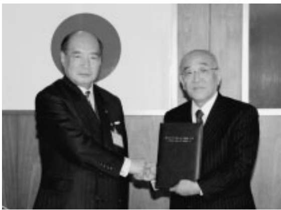
▲明治大学と相互友好協定を締結

●環境美化…市民事業者と美化協定を締結するとともに、喫煙禁止路線でのパトロール活動を強化して、きれいなまちの保全に努めます ●環境美化…市民事業者と美化協定を締結するとともに、喫煙禁止路線でのパトロール活動を強化して、きれいなまちの保全に努めます