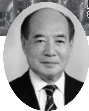
府中市長 野口 忠直