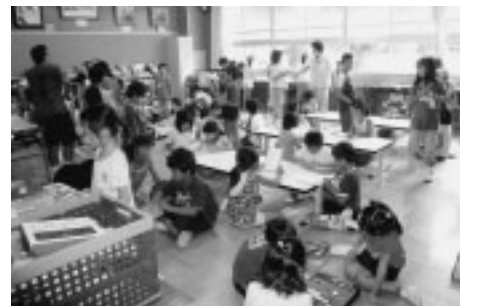
▲子どもたちの健やかな成長を支援します

友好都市ウィーン市ヘルナルス区や姉妹都市長野県佐久穂町との市民交流を推進・支援します。また、府中国際交流サロンの活動を中心に、国際交流、相互理解を促進します。