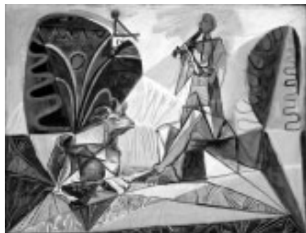
▲パブロ・ピカソ「羊飼いと山羊(牧歌)」(1946年)

本展では、その流れを、アメリカのバサール大学附属フランス・リーマン・ロブ・アート・センターのコレクションから選び出した、ピカソ、マティス、シャガール、オキーフ、ロスから74作家86点の作品を通してたどります。問合せは、府中市美術館(336・3371)へ。