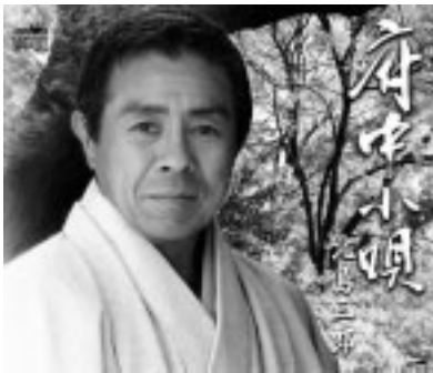
「ぜひ、鑑賞ください」

リジナルカラオケ、女声用カラオケ、音楽のみ) ▽価格 800円 ▽問合せ 経済観光課観光係(335・4095)、または府中観光協会(302・2008)