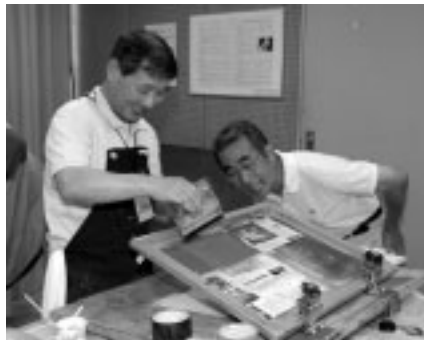
▲鮮やかな色合いが楽しめます

9月24日(水)・28日(日)午後1時~5時 版画室ほか/対象は20歳以上の市民/定員各日5人/無料/講師はシルクスクリーン「あさぎ」スタッフ/下絵(A4判)持参