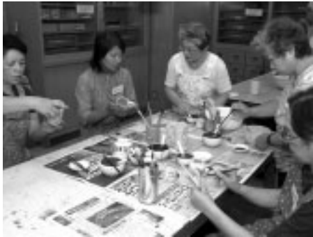
▲自分だけの作品を作ってみませんか

①9月20日(土)午前10時~正午・27日(土)午後1時半~2時45分、②9月20日(土)午後1時半~3時半・27日(土)午後3時~4時15分 工房1ほか/対象は16歳以上で全回出席できる市民/定員各20人/無料/講師は当該陶芸ボランティア