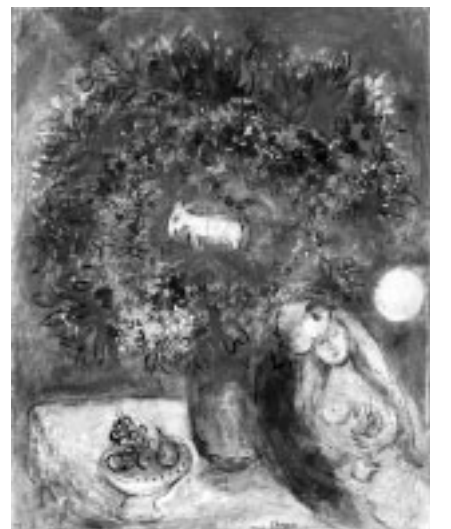
▲マルク・シャガール「花束」(1952-53年)©ADAGP, Paris & SPDA, Tokyo, 2008