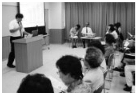
▲介護予防に取組みましょう

12月16日(火)午前10時半～正午／対象は市民／先着50人／無料／内容は介護予防の効果についてほか／講師は大淵修一氏(都老人総合研究所室長)／申込みは電話で当館へ