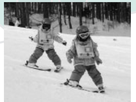
▲冬の思い出をつくりませんか