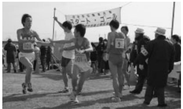
◀たすきにみんなの思いを託します

返信用封筒に80円切手をはって生涯学習スポーツ課へ ▽問合せ 生涯学習スポーツ課スポーツ振興係(335・4499)