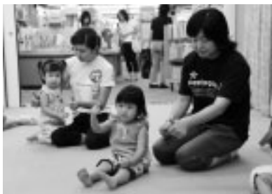
楽しいわらべうた