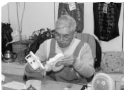
▲おもちゃをいつまでも大切に