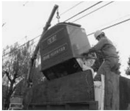
現在のダストボックスによる収集方式

の収集を指定袋により有料化 ○戸別収集方式の導入 ○ダストボックスによる収集方式の廃止