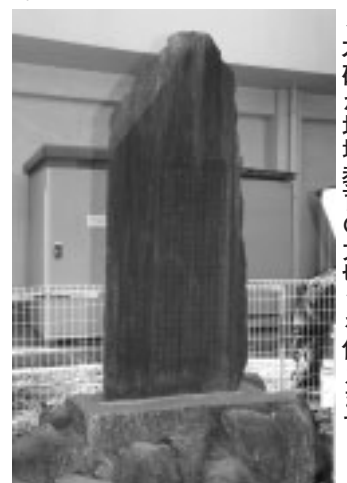
石碑が地域教育の大切さを伝えます