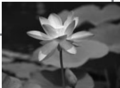
▲郷土の森公園修景池に咲く優美で気品ある花蓮(蓮を観る会)

▽11日~13日…「蓮を観る会」を郷土の森公園修景池で開催 ▽19日~27日…「地域まつり」を各文化館で開催 ※「広報ぶちゅう」「ふちゅう市議会だより」の希望配布を開始。