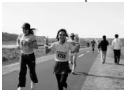
▲心地よい風の中を走る多摩川マラソン大会

▽3日…「市民朝市」をフォーリス前で開催 ▽4日…中小企業事業資金融資で無利子の「緊急対策資金」を新設 ▽7日・8日…「消費生活展」を府中グリーンプラザ分館で開催 ▽15日・16日…「農業まつり」を郷土の森博物館で、「NPO・ボランティアまつり」を府中グリーンプラザなどで開催 ▽23日…「多摩川マラソン大会」を府中多摩川かぜのみちで開催 ▽27日…白糸台掩体壕を市の史跡に指定、谷中真吾彰徳碑を市の有形文化財(歴史資料)に登録