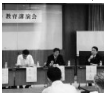
学校と協力して教育改善に努めます