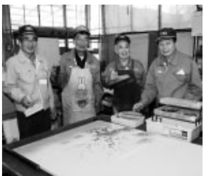
▲豊かな経験と能力を生かして、丁寧な仕事を行います