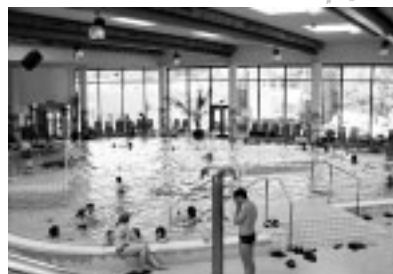
▲一年を通して多くの人々にぎわう温浴場

本市とオーストリア共和国ウィーン市ヘルナルス区は、友好都市の盟約を結んでいます。今号では、ウィーンの春とウィーン市民に親しまれている温泉について紹介します。