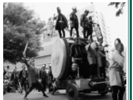
▲くらやみ祭に鳴り響く太鼓の音を体感ください

くらやみ祭では、初夏のさわやかな緑に彩られて練り上げられる大太鼓の競演をご覧ください。