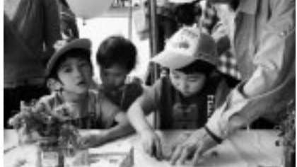
▲自然の美しさを写す「葉っぱプリント」