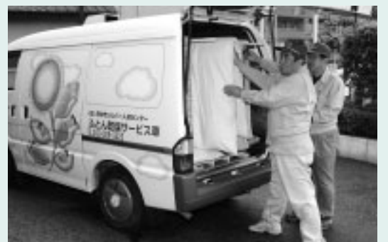
▲ふとん乾燥車がご自宅に伺います

スローイングイベントボード8台 ■福祉基金へ ▽麻の実会 三万六八四八円 ■社会福祉協議会へ ▽東京都宅地建物取引業協会府中稲城支部 八万七四八〇円 ▽は もに 一七二円 ▽都立府中西高校PTA 一万円 ▽東京家政大学 三万円 ▽分梅青年会 一万五千円 ▽矢崎歯科医院と患者さん 一同 二万八八七五円