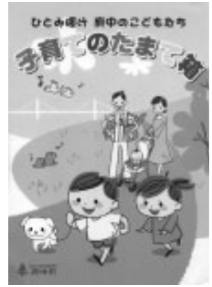
子育ての情報が満載です

▽配布場所 市役所6階子育て支援課、子ども家庭支援「たちしらとり」、各文化館、市政情報館、スクエア21・女性館、保健館分館 ※子育てのたまて箱は、市のホームページ( http://www.city.fuchu.tokyo.jp/ )でもご覧になれます。 ▽内容 主に妊娠時から小学校就学前の子どもを対象とした、市の事業や子育てについての様々な情報を掲載 ▽問合せ 子育て支援課推進係(335・4192)