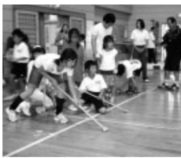
ぜひ、ご参加ください