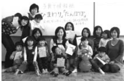
▲たんぼぼで広がるみんなの笑顔