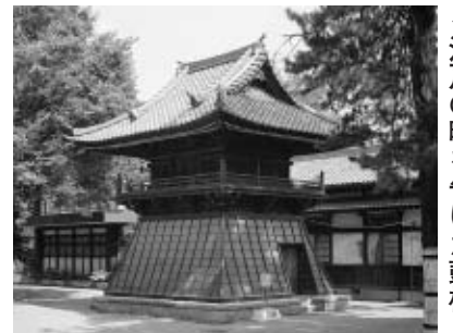
◀江戸の時を告げた鼓樓

現在、府中で太鼓といえば、くらやみ祭などで打ちならされる大太鼓が有名ですが、府中の宿場町に時の太鼓の音が毎日響いていた江戸の時代に、思いをはせてみるのはいかがでしょうか。