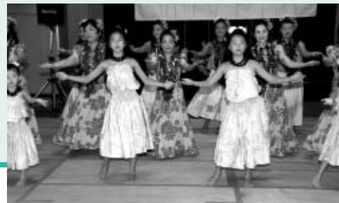
▲市民による様々な催しが行われる生涯学習フェスティバル

▽21日…「敬老の日記念大会」を府中の森芸術劇場で開催 ▽11日～13日…「生涯学習フェスティバル」を生涯学習館で開催 ▽13日～11月28日…「市民芸術文化祭」を府中の森芸術劇場などで開催