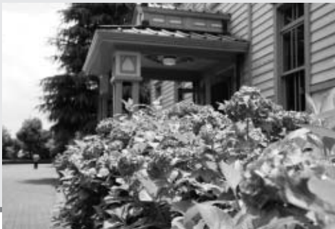
▲約30種1万株のあじさいが咲き誇る郷土の森博物館

▽1日…「ふちゅうGOGO商品券」を発売 ▽2日～7月5日…「あじさいまつり」を郷土の森博物館で開催 ▽7日…「リサイクル&環境フェスタ」を府中公園で開催 ▽21日…「ボールふれあいフェスタ」を郷土の森総合体育館で開催