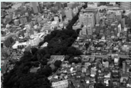
▲国史跡に指定された武蔵国府跡周辺

▽5日～11日…「蓮を観る会」を郷土の森公園修景池で開催 ▽18日～26日…「地域まつり」を各文化館で開催 ▽23日…武蔵国府跡が国史跡に指定