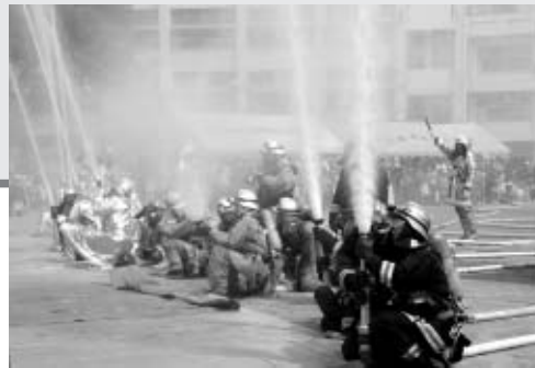
▶消防団による一斉放水(総合防災訓練)

▽7日～9日…「商工まつり」を大國魂神社で開催 ▽22日・23日…「けやきフェスタ～よさこいin府中」をけやき並木を中心に開催 ▽23日…「総合防災訓練」を六小で実施 ※武蔵府中熊野神社古墳保存・整備が完了。