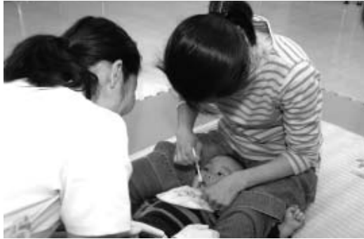
正しい歯磨きで健康な歯を保ちましょう

1月15日・22日(金)/午前10時半、午後1時半/対象は平成20年12月生まれの幼児と保護者/内容は歯科衛生士による歯磨き指導/申込みは予防歯科指導担当(368・5322)へ