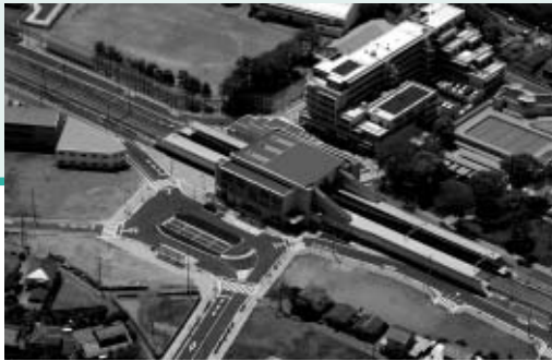
▶市内14番目の駅となる西府駅

▽11日…市議会定例会で、家庭ごみの有料化と収集方法の変更に関する条例が可決 ▽14日…JR南武線西府駅が開業 ▽23日～4月5日…「市民桜まつり」を桜通りと府中公園を中心に開催