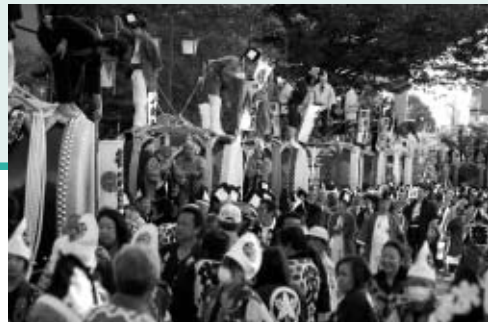
▶迫力ある大太鼓の競演(市制施行55周年記念パレード)

▽1日…「ふちゅうGOGO商品券」を再発売 ▽3日…「市制施行55周年記念パレード」をけやき並木通り周辺で開催 ▽6日・7日…「消費生活展」を府中グリーンプラザ分館で開催 ▽7日…「府中元氣一番まつり・福祉まつり」を味の素スタジアムで開催 ▽14日・15日…「農業まつり」を郷土の森博物館で、「NPO・ボランティアまつり」を府中グリーンプラザなどで開催 ▽15日…「府中の森の文化まつり」を府中市美術館、生涯学習館、府中の森芸術劇場で開催 ▽23日…「あきかん～府中エコ博」をルミエール府中で、「多摩川マラソン大会」を府中多摩川かぜのみちで開催 ▽28日・29日…「男女共同参画推進フォーラム」をスクエア21・女性館で開催 ※FC東京がJリーグヤマザキナビスコ杯で優勝。