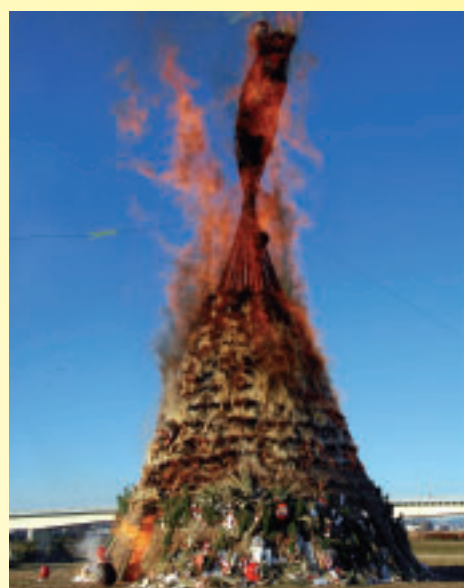
▲無病息災を願って