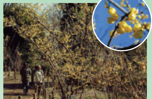
▲一足早い春の訪れを感じてみませんか