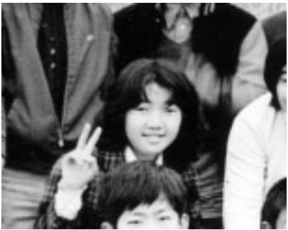
自然の中で遊んでいた小学生時代

よかったことに気付くんですが、他市では6・7人で1台を使う顕微鏡も1人1台だったんです。勉強するにはとてもいい環境だったと思います。