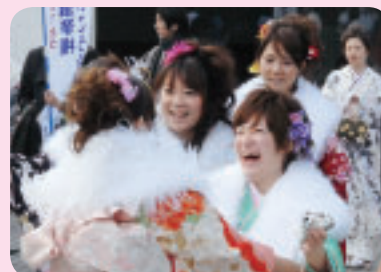
▶再会に笑顔があふれます

▽日時 1月11日(祝)午後零時半 ▽会場 府中の森芸術劇場 ▽対象 平成元年4月2日から平成2年4月1日生まれの方 ▽内容 式典、「おめでとうメッセージ」の展示ほか ▽問合せ 児童青少年課青少年係(335・4427)