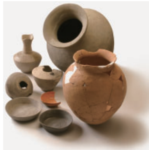
◀貴重な出土品を、ぜひご覧ください

市では、武蔵国府の全容解明を目指して、多くの発掘調査を積み重ねてきました。近年では、国府の中核施設である国衙の解明も大きく進み、国府のまちの姿が全国に先駆けて明らかになってきています。