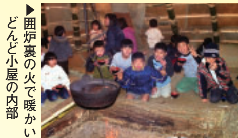
▶囲炉裏の火で暖かい どんど小屋の内部