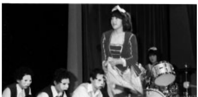
芸能界にあこがれを抱いていた中学生時代

太田 くらやみ祭には昼間に山車などを見に行ったことはありますが、夜は学校から止められていたもので、みこしを見たことがない