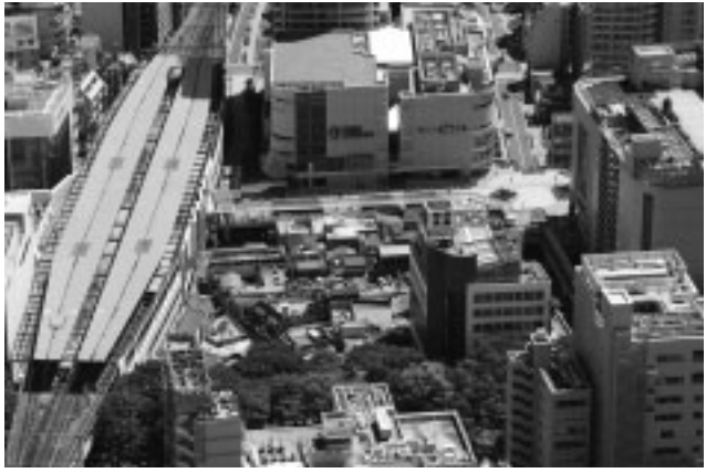
▲府中駅南口市街地再開発事業の集大成となる第一地区

最後に、新年の目標、抱負ですが、今年、「寅年」ということもありまして、トラは千里を走るといわれますので、私は行動力を象徴する年として「動く」としました。 2月2日(火)から、40年使用していたダストボックスがなくなり、新しいごみの収集方法に移りますが、市民の皆様のご協力をいただきスムーズに移行させたいと思っています。そのほか、府中駅南口市街地再開発事業の最後の再開発に向け、本組合が設立される予定で、これは将来の府中市にとって大きなことであると期待をしています。また、けやき並木通りを歩行者優先のいこいの空間化にするという大きな仕事がいよいよ今年動き出します。そのような意味でも今年「動く」年になり、飛躍の1年にしたいと思います。