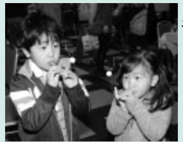
楽しく科学と触れ合おう