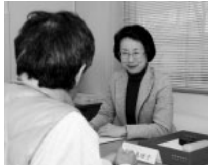
公正・中立の立場で