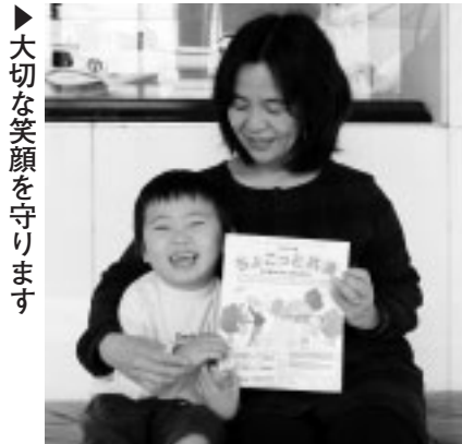
大切な笑顔を守ります

※見舞金の請求には、交通事故証明書などの提出が必要です。交通事故に遭ったときは、自転車の単独事故などでも必ず警察に届け出てください