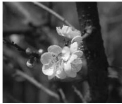
伊達政宗が朝鮮から持ち帰ったといわれる「臥龍梅」

▽日時 2月6日から3月6日の毎週土曜日午後1時～2時 ▽内容 園内の文化財建物を巡り、昔の生活を体感する ▽申込み 当日午後零時55分に、川崎平右衛門広場へ