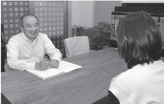
▲私たちにご相談ください