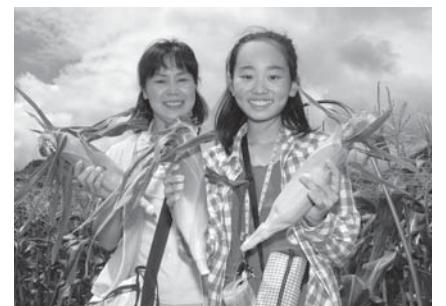
▲自然を楽しみながら収穫しませんか

民活動支援課内)へ ▽問合せ 府中友好都市交流協会事務局(335・4131=市民活動支援課内)