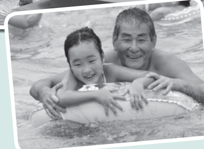
▲暑い夏もプールで元気いっぱい

7月17日(土)に、市のプールがオープンします。各プールの開催日時などは右の表のとおりです。 問合せは、郷土の森総合プールは郷土の森総合体育館(363・8111)、市民プール、美好水遊び広場、各地域プールは生涯学習スポーツ課施設係(335・4488)へ。