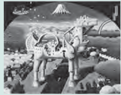
▲立石大河亞「登呂井富士」(1992年)