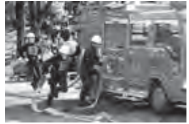
▲府中市消防団によるポンプ操法訓練

府中市消防団は、日ごろから地域の防災リーダーとして、防災訓練や防火・防災の啓発活動を行っています。火災などの際には、市民の生命や財産を守る活動をしています。今回、中央防災センターと府中消防署が併設されたことで、より密接な連携が可能となり、さらに効果的な消防活動ができると考えています。今後も、市民の皆さんの温かいご支援とご協力をお願いいたします。