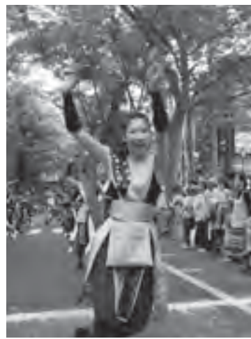
▶けやき並木で熱く踊ろう

市のシンボルけやき並木周辺で、けやきフェスタ「よさこいin府中」を開催します。緑豊かなけやき