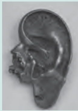
▲三木富雄「耳」(1964)5年ごろ

▽観覧料 一般300(240)円、高校・大学生150(120)円、小・中学生70(50)円/( )内は20人以上の団体割引/未就学児、障害者手帳などをお持ちの方は無料/市内の小・中学生は「学びのパスポート」をご利用ください