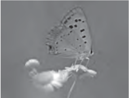
▲日本各地で見られる「ベニシジミ」

7月17日(土)から9月5日(日)午前9時~午後5時(入室は午後4時まで) 本館特別展示室/無料/内容は標本や写真パネルによる身近な日本の昆虫