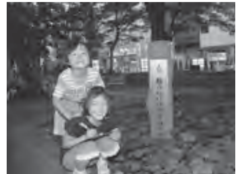
▲楽しく巡ろう、ふるさと府中

市にゆかりのある文化財、名所、旧跡や自然をテーマに詠まれた「郷土かるた」の標識を探し、楽しく府中を学んでみませんか。 ▽期間 7月24日(土)から31日(土) ▽対象 小学生以上の方/小学生は保護者同伴 ▽費用 無料 ▽内容 指定された郷土かるたの標識を探し、決められた用紙(期間中に観光情報誌で配布、27日を除く)に、標識の中の人物・動物・植物を書く ※参加者には、記念品を差しあげます。 ※観光案内ボランティアによる標識案内を希望する方は、24日午前10時に観光情報誌にお集まりください。 ▽問合せ 経済観光課観光係(335・4095)、または観光情報誌(302・2000)