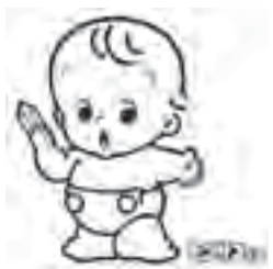
▲国勢調査マスコットキャラクター

10月1日(金)を基準日として、全国一斉に国勢調査が実施されます。 国勢調査は、日本国内に住んでいるすべての方を対象に国が行う統計調査で、行政の基礎となる人口・世帯の実態を明らかにする基本的な調査です。