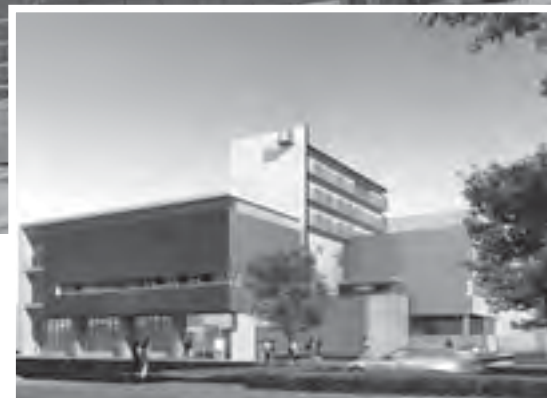
▲中央防災センター・府中消防署新庁舎の外観図