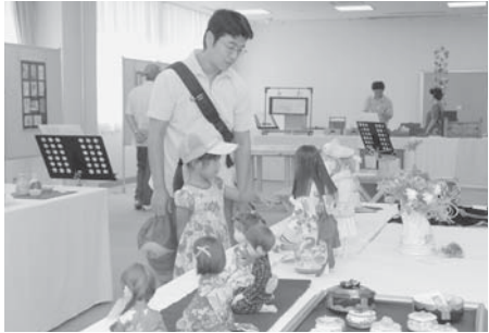
▲力作を出展してみませんか

展示は9月7日(水)から11日(日) 研修室ほか/対象は市民、市内在勤・在学の方、または会員の半数以上が市民、市内在勤・在学の方で構成された団体/先着420人/出展は1人1点/内容は絵画や写真、工芸作品ほか/規格は幅1.2m以内/申込みは5月9日(月)から