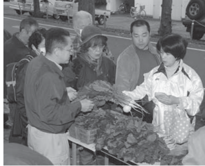
▲自慢の品を提供してみませんか

▽対象 ○市内で農産物などを生産している方 ○市内で店舗を構え、営業している方 ○手作りの品物やリフォーム品などを販売したい方 ▽出店料 無料 ▽申込み 5月2日(月)までに、決められた用紙(市役所4階経済観光課に用意)で、経済観光課へ ▽問合せ 経済観光課消費生活係(335・4124)