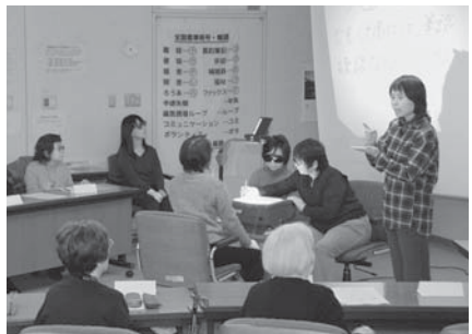
▲文字通訳を利用した会議

▽中途失聴・難聴者「つばさの会」府中(押立町4の13/FAX042・483・9443)