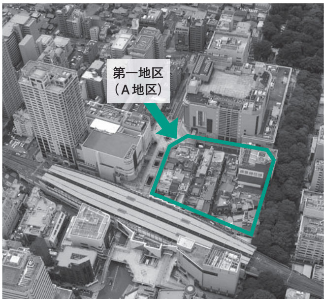
▲にぎわいと魅力あふれるまちづくりを推進します(府中駅北側上空から撮影)

市では、「心ふれあう 緑ゆたかな 住みよいまち」を目指し、第5次府中市総合計画後期基本計画の重点プロジェクトの1つとして、再開発事業の推進に取り組んでいます。 府中駅南口は、市の表玄関として、また、中心商業地としてのまち並み再生を図るため再開発事業を計画し、これまでに第二・三地区の事業が完了しています。残る第一地区は、府中駅南口再開発事業の総まとめとなります。 5月26日に、都知事より府中駅南口第一地区市街地再開発組合の設立認可を受け、6月20日に開催された組合の設立総会によって体制が整い、具体的に事業が進められることになりました。 また、施設建築物内の地上5・6階に整備を計画している公共公益施設の活用について、さらなる検討を行います。 問合せは、再開発事業については、府中駅南口周辺整備担当(368-7503)へ、公共公益施設(5・6階)については、政策課(335-4010)へ。