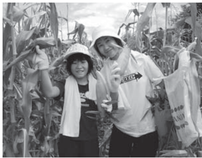
▲新鮮なとうもろこしを、ぜひ!