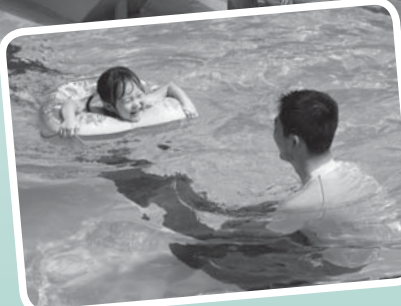
▲暑い夏はみんなでプールへ!

問合せは、郷土の森総合プールは郷土の森総合体育館(363・8111)、市民プール、美好水遊び広場、各地域プールは生涯学習スポーツ課施設係(335・4488)へ。