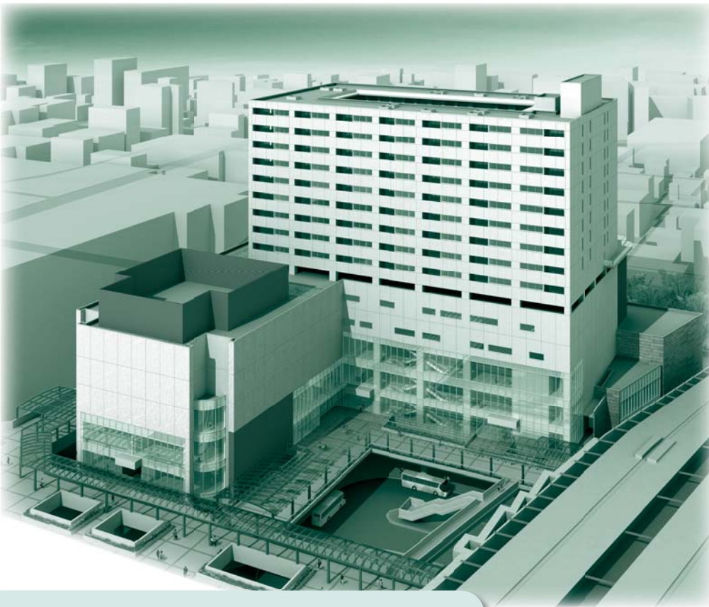
▶府中駅南口第一地区完成予想図