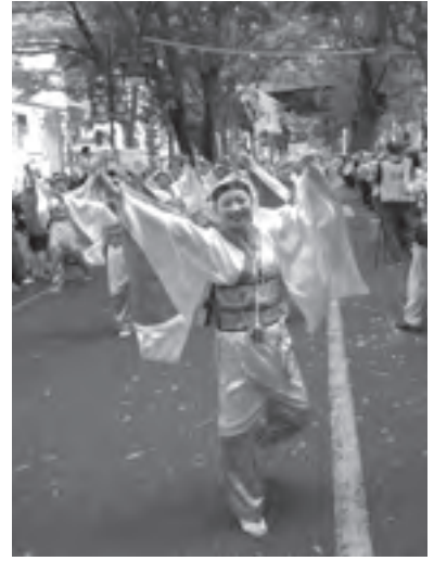
一緒に熱く踊りませんか

費)/内容は画用紙でしかけ絵本やカードを作る/申込みは電話で、または直接中央図書館へ