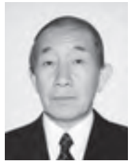
紅葉丘/36 1・3136/ 69歳

委嘱されました。任期は3年です。 基本的な人権が侵害される諸問題や夫婦・親子・近隣関係のもめごとなどについて、お気軽にご相談ください。 問合せは、市民相談室(366・1711)へ。