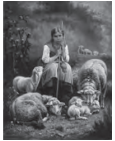
▲アンリ・ド・ブル「羊飼いの少女」(1881年)

手帳などをお持ちの方は無料/市内の小・中学生は「学びのパスポート」をご利用ください