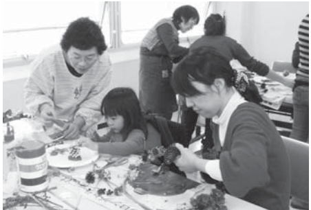
▲手作りリースでクリスマスを華やかに

▽日時 12月11日(日)午後零時半~4時 ▽会場 武蔵台文化センター ▽対象 市民 ▽定員 20人(抽せん) ▽費用 300円 ▽申込み 11月22日(火)まで(必着)に、はがきに参加希望者全員の住所、氏名(ふりがな)、年齢(学年)、電話番号を記入して、環境安全部環境政策課「講習会」係(〒183-0056寿町1の5)へ ▽問合せ 環境政策課自然保護係(335・4315)