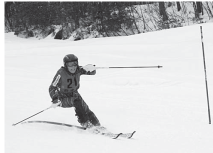
▲新記録を目指して

▽日程 平成24年1月28日(土)・29日(日) ▽会場 北志賀高原よませ温泉スキー場(長野県)／現地集合・解散 ▽対象 中学生以上で、市民、市内在勤・在学の方／中学生は保護者、または責任者同伴 ▽費用 無料／交通費、宿泊費、リフト代は自己負担 ▽種目 回転競技、大回転競技／いずれも男子1～5部、女子1～3部、中学生の部 ▽申込み 11月24日(木)までに、決められた用紙(府中駅北第2庁舎4階生涯学習スポーツ課に用意)で生