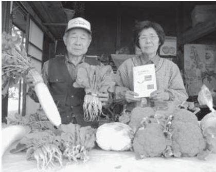
▲地元の農産物を買いに出掛けませんか

府中産の新鮮な農産物を販売している、55か所の直売所を載せた「府中産農産物直売所マップ」を、無料で配布しています。 ▽配布場所 市役所1階市民相談室・4階経済観光課、各文化センター、市政情報センター、観光情報センター ※在庫がなくなり次第、配布を終了します。 ▽問合せ 経済観光課農政係(335・4143)