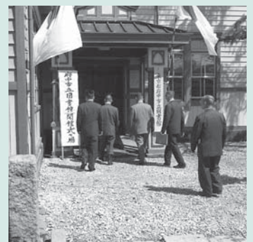
昭と36年に旧府中町役場に開館した図書館