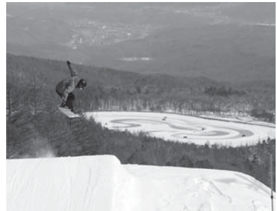
▲八千穂レイクを眼下に

▽期間 12月3日(土)から4月1日(日) ▽リフト券料金 1回券350(250)円、半日券2700(2000)円、1日券(平日)3200(2400)円、1日券(土・日曜日、祝日)3500(2600)円、2日