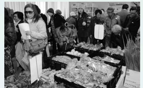
▲郷土の森観光物産館が開館(19日)

▽3日…「あきかん～府中エコ博」をルミエール府中で開催 ▽12日・13日…「府中NPO・ボランティアまつり」を府中グリーンプラザなどで開催 ▽19日・20日…「農業まつり」を郷土の森博物館で開催 ▽23日…府中の森芸術劇場の入場者が1000万人を突破 ▽26日・27日…「武蔵府中熊野神社古墳まつり」を武蔵府中熊野神社で開催 ▽26日・27日…「男女共同参画推進フォーラム」をスクエア21・女性センターで開催