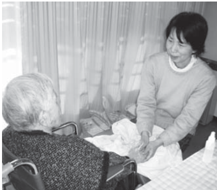
▲優しく包み込むように