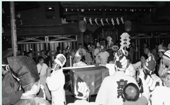
▲「くらやみ祭」が神事のみで行われ、渡御・還御はみこしではなく唐櫃で行われた(5日)

▽8日…「多摩川清掃市民運動」に4285人の市民が参加し、約4.7トンのごみを回収 ▽11日・12日…市議会臨時会が開かれ、議長に村木 茂氏、副議長に遠田宗雄氏が就任 ▽22日…「合同水防訓練」を多摩川緑地是政地区(是政4丁目)で実施