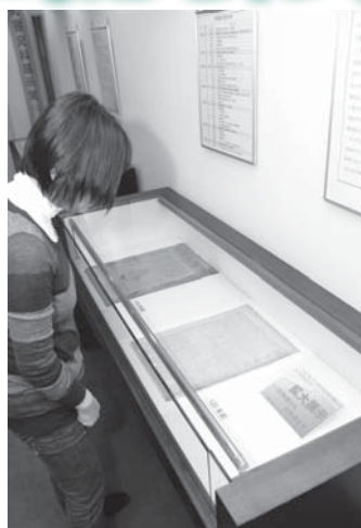
各時代の紙面から歴史の息づかいが伝わります