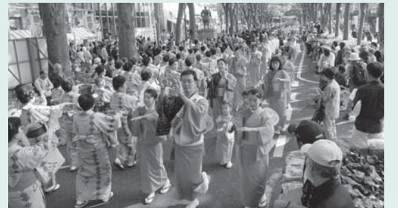
▲「武蔵府中ふるさとまつり」をけやき並木通り周辺で開催(9日)

▽1日…府中市暴力団排除条例を施行 ▽15日・16日…「福祉まつり」を府中公園で開催 ▽21日・22日…「ふちゅうテクノフェア」をルミエール府中で開催 ▽22日…「給食展・大試食会」を第一・第二学校給食センターで開催 ▽24日…府中駅南口市営駐車場の利用台数が1000万台を突破 ▽29日…「リサイクルフェスタ」をすずかけ公園で開催