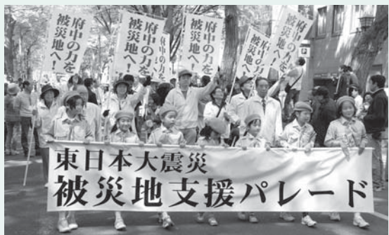
▲東日本大震災被災地支援パレードをけやき並木通り周辺で実施(17日)

▽1日…ふるさと府中歴史館が開館 ▽1日…金塚桜広場を開設 ▽20日…市民の皆さん、団体、企業などから提供された支援物資を宮城県多賀城市に搬送 ※都知事選挙・市議会議員選挙を実施。