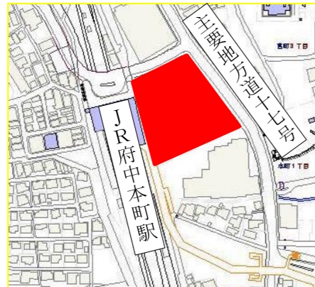
A-2 府中駅・府中本町駅周辺地区 暮らしにぎわい再生事業(住宅局) (武蔵国府跡内(国司館地区)賑わい交流施設整備)