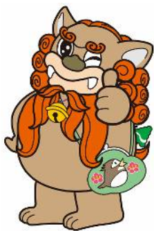
府中市マスコットキャラクター