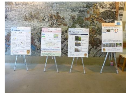
前回のオープンハウスの様子