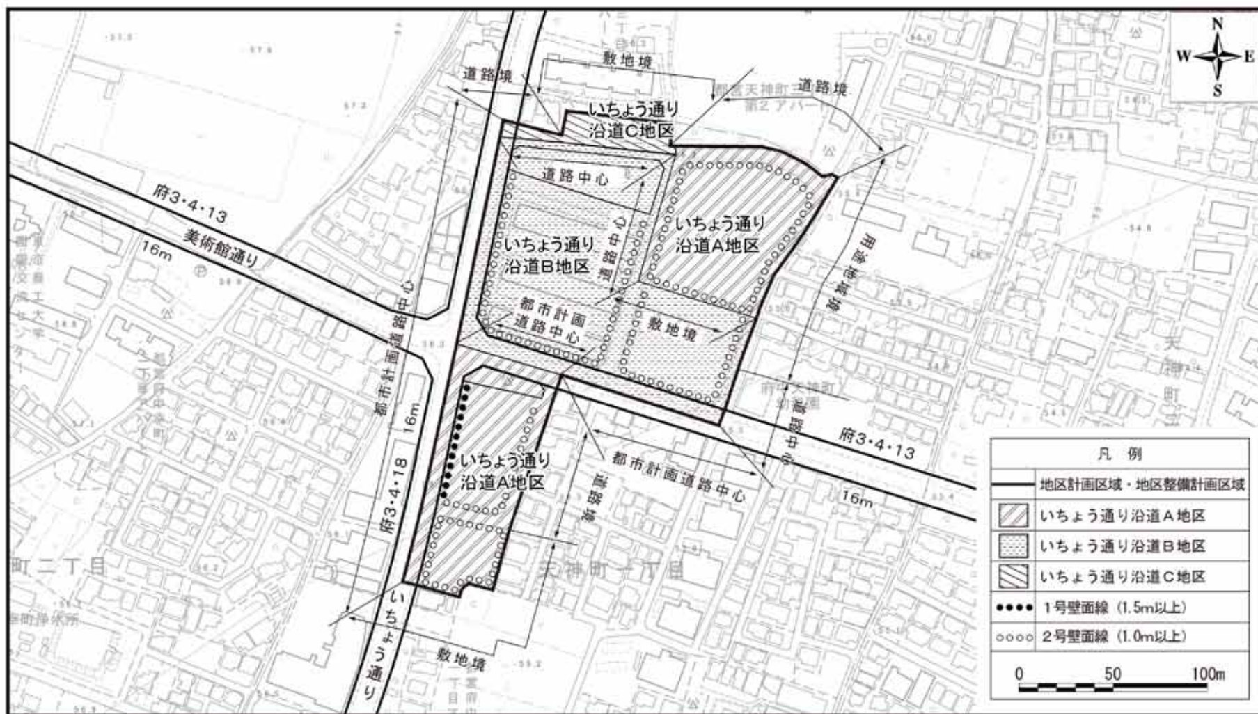
天神町一丁目地区地区計画 計画図 1