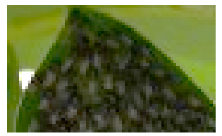
ナミテントウ クロホソスジハマダラミバエ クロヒラタアブ