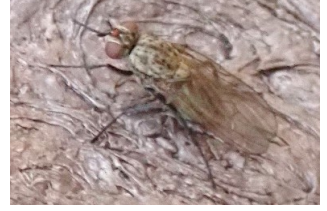
オオクロバエ クロバエ ヤマギシモリノキモグリバエ