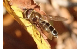
ホソヒラタアブ ミドリキンバエ