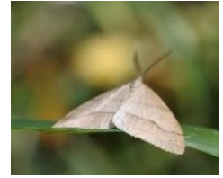
モンシロドクガ ネグロミノムシ ヒメフンバエ ヒメフンバエの仲間