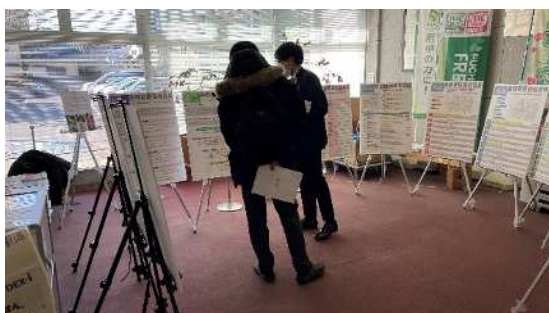
図 当日の様子(白糸台)