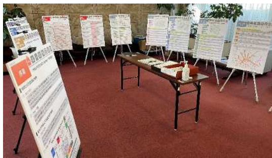
図 当日の様子(西府)