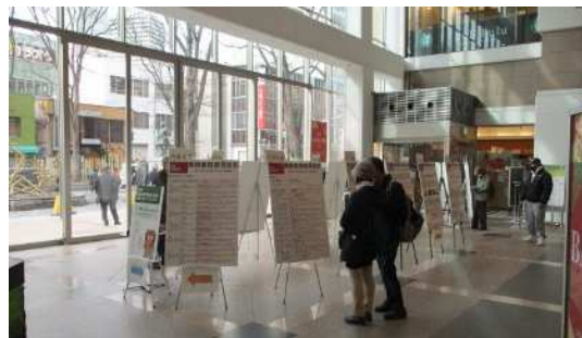
図 当日の様子(フォーリス)