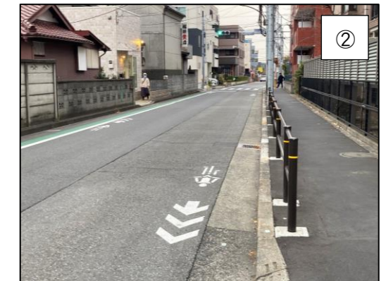
▲自転車ナビマークの標示