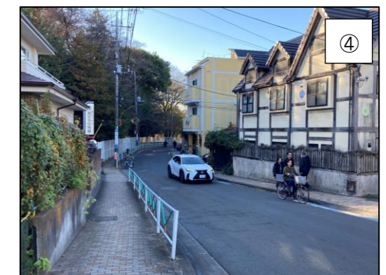
▲各交通手段の通行に課題