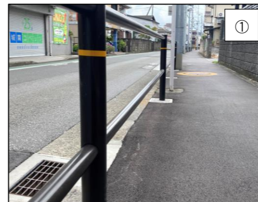
▲歩行者空間を確保