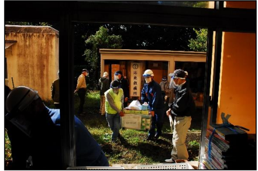
避難所設営資機材の準備