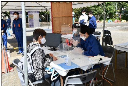
り災証明書発行訓練