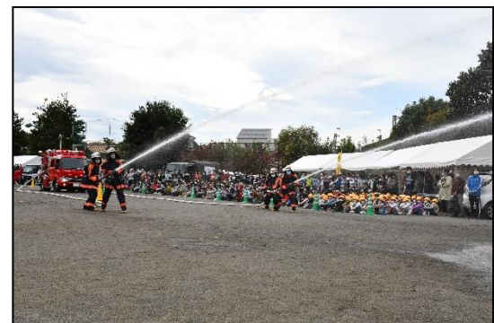
府中市消防団による放水演習