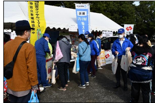
協力機関展示PRコーナー