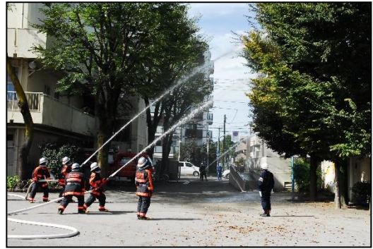
消防団による放水演習