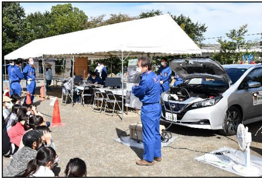
電気自動車による外部給電