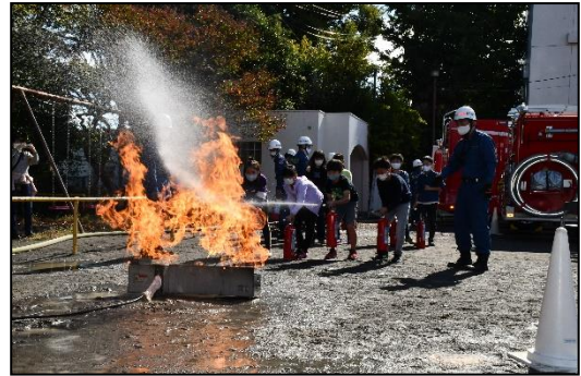
消火器による消火訓練