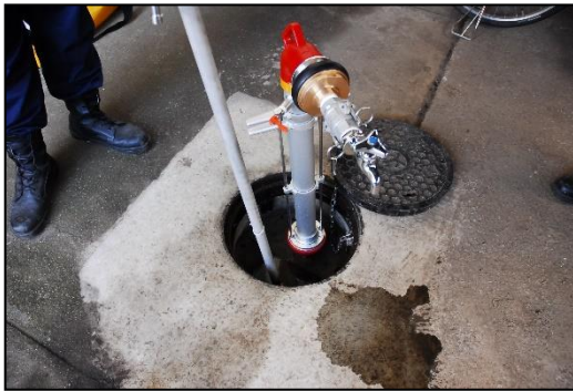
応急給水栓の確保