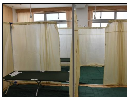
要配慮者スペースの設置