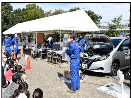
電気自動車による外部給電