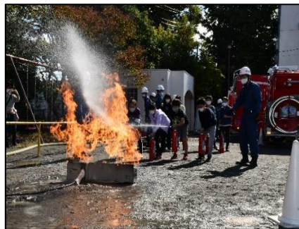
消火器による消火訓練