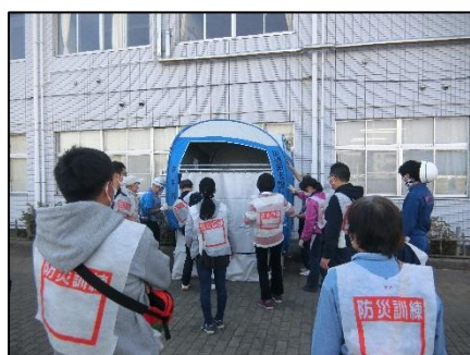
仮設トイレの設置