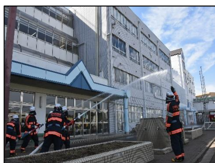
消防団による放水演習