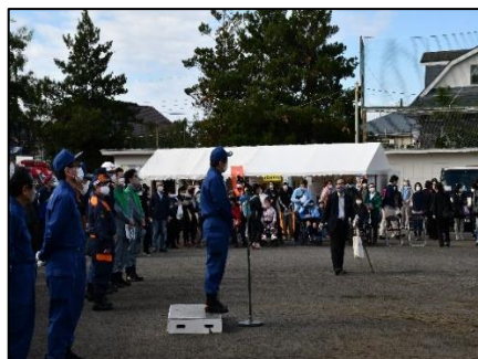
住民避難訓練 (参加者の集合)