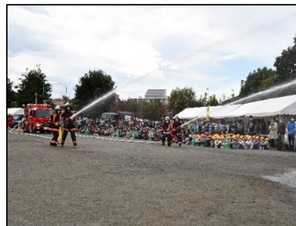
府中市消防団による放水演習