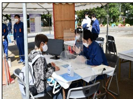
り災証明書発行訓練