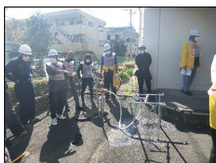
応急給水栓の設置