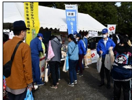
協力機関展示PRコーナー