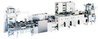
連続式炊飯システム 炊き込みご飯も調理可能な、連続式炊飯システム導入し、米飯給食を充実します。