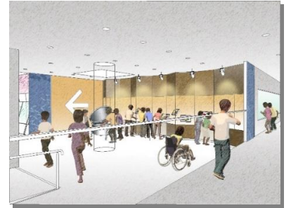
実物の厨房設備を設置し、体験できる空間を設置します。