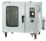
スチームコンベクションオープン 焼く、蒸す、蒸し焼きなど多彩な新しい献立が可能となります。