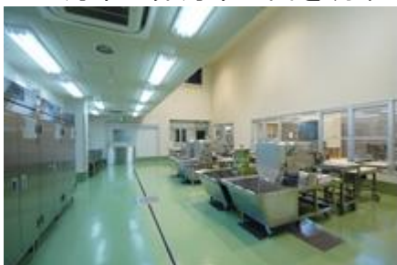
調理前後で、区画を分けることで、温度管理や空調の効率化を図ります。