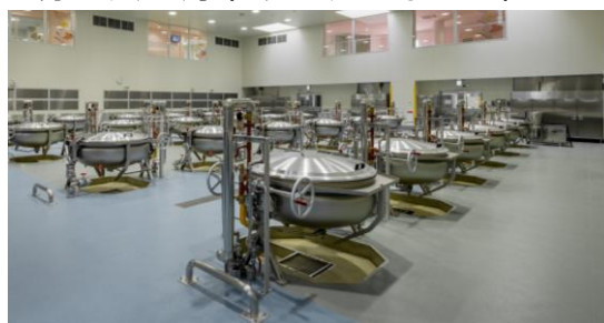
調理ラインをわけ、食材の交差がないようにします。