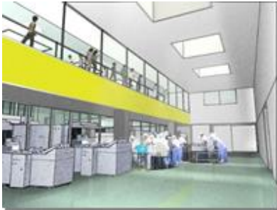
見学通路は、中2階的に設置し、臨場感にあふれた空間とします。