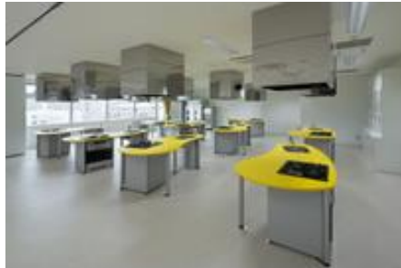
給食調理教室や親子調理体験教室が実施可能な調理実習室とします。