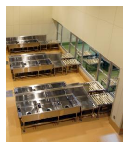
汚染・非汚染区画は食材のみを受け渡します。