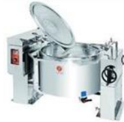
電気式回転釜 カレーのルーなどが調理できるよう、微妙な温度調整が可能です。