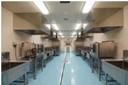
荷受→調理→配缶までを他とは完全に独立したアレルギー対応調理室とします。

※なお、平成30年度からは、アレルギー対応品目を現在の卵、ナッツ類、飲用牛乳、果物に加え、新たに乳・乳製品、エビ・カニに拡大し除去・代替対応をします。