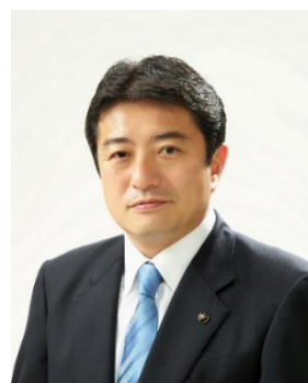
府中市長 高野律雄