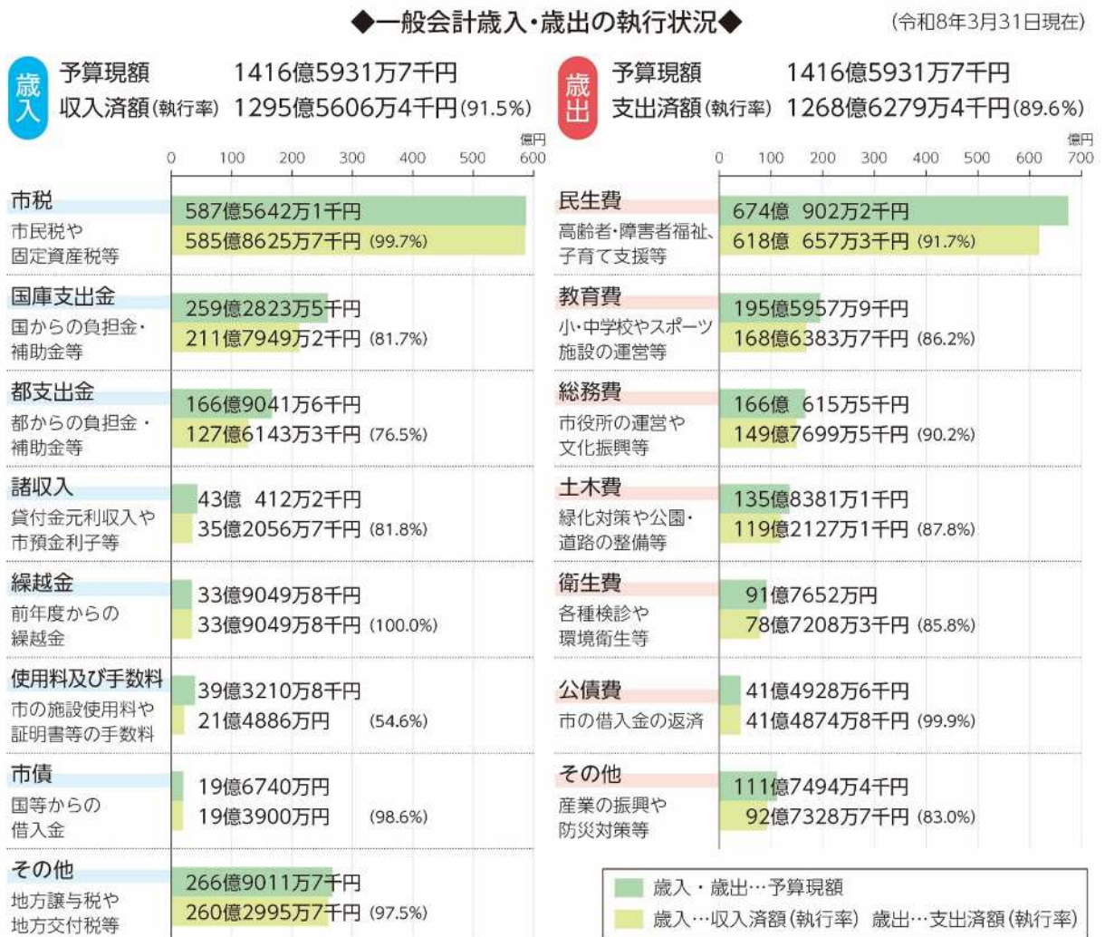
図表1 令和7年度一般会計歳入歳出予算執行状況

令和8年3月31日現在の令和7年度一般会計歳入歳出予算の執行状況については、図表1のとおりです。歳入の執行率は91.5%で、前年同期と比較して2.0ポイントの減となっています。歳出の執行率は89.6%で、前年同期と比較して9.6ポイントの増となっています。