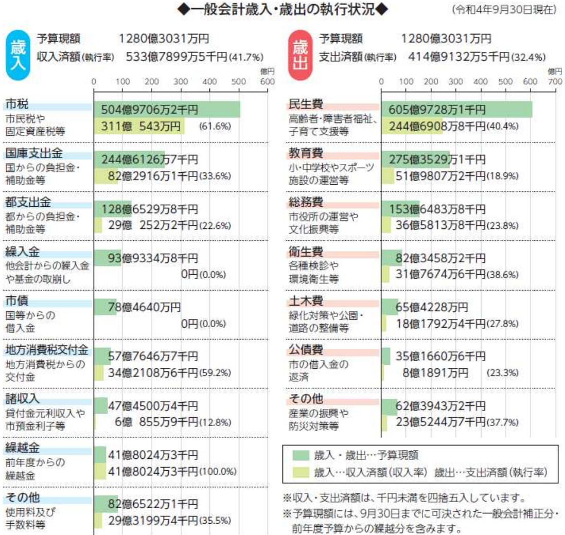
図表1 令和4年度一般会計歳入・歳出予算の執行状況