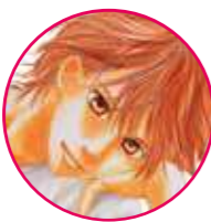
おおえ かなで 大江 奏

府中白波会所属のA級選手。瑞沢高校かるた部部長。スポーツ万能。成績優秀、容姿抜群。千早の事を幼いころから一途に思い続けている。