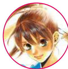
あやせ ちはや 綾瀬千早

府中白波会所属のA級選手。瑞沢高校かるた部キャプテン。「かるたバカ」と言われるほど、かるたを愛している。無駄美人である。