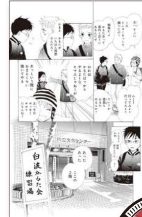
ちはやふる 1巻 第2首より

府中白波会の練習場になっており、千早が本格的に競技かたるた世界へのめり込むきっかけとなった原点といえる「市立文化センター」。こちらのモデルとなった片町文化センターには、この度「ちはやふる」作者の末次先生に描き下ろして頂いた小学生時代の千早・太一・新が描かれたマンホールを設置。