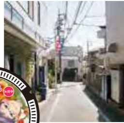
ちはやふる 1巻 第4首より

千早・太一・新が小学生時代を過ごした場所として描かれる街並みのモチーフの一つとなっている「分倍河原駅商店街」近郊にもマンホールを設置。