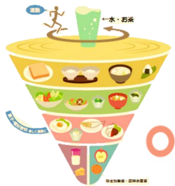
バランスの良い例