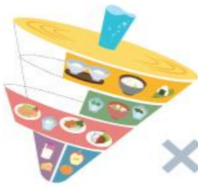
バランスの悪い例 (主食と副菜が欠けて、主菜が多すぎる例)

「健康のために1日に何をどれだけ食べたらよいか」をコマの形で表しています。食事は 主食(ご飯・パン・麺類など) 、 主菜(肉・魚・大豆製品・卵など) 、 副菜(野菜類・きのこ類・海藻類など) を基本に、 乳製品 や 果物 も取り入れていきましょう。