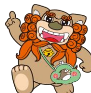
府中市マスコットキャラクター