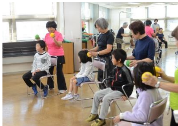
笑顔で、大きく声を出して♪