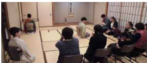
お抹茶美味しいです！

今回のお席は、本来は炉の時期ですが風炉を使い、表千家特有の細水差しの「蘆瀑」と割蓋の茶器「老松」を用いた中置で、名残りの茶の風情で運びの薄茶点前をいたしました。どなたでもお気軽にお抹茶を楽しんでいただけるよう椅子席も用意して、老若男女お子さんや外国人の方も合わせて6席58名ものお客様をお迎えすることができました。お出ししたお抹茶や主菓子に、小さなお子さんも美味しいと言ってくださり、講師の、お花・お軸やお道具などのほか、表千家流の茶道の特徴など、詳細にわたるわかりやすい説明に、皆様、お茶席の楽しみを満喫されたようで大変満足された様子でお帰りいただき、社中一同大変うれしく思いました。