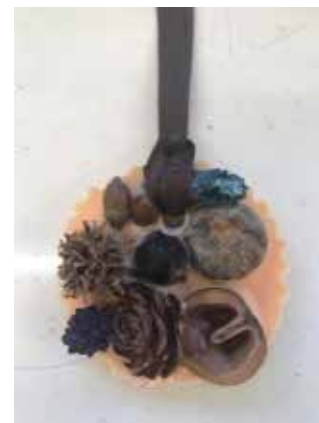
木の実の標本みたいなアロマワックス

木の実の標本は市内で採集した物を主に使いましたので、今回のフォーラムテーマ「地域で“自分らしく”生きる」に沿った作品になったのではないかと思います。