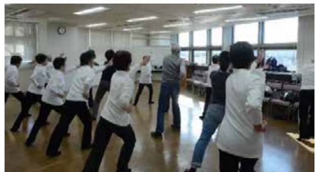
気の流れを感じて

一般の参加者4名の中には経験者の方もいて、上手に呼吸も合い気持ちよくできました。