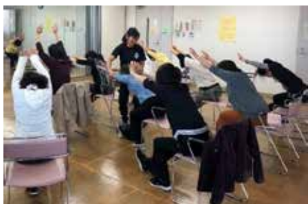
腕がラクに上がる！伸びる！