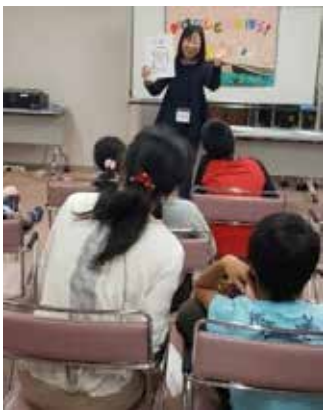
スタッフによるミニおはなし会♪

子どもから大人まで、あらゆる世代におはなしの世界を楽しんでいただきたいと、活動をしています。赤ちゃん和妈妈対象のひろば、大人向けの語りの会を、定期的で開催していますが、フォーラムでは、月1回開催している、小学生と保護者対象の「言葉とあそぼう！体験型おはなし会」を公開しました。この講座では、みんなの前で絵本やおはなしを語ってもらう、おはなし会を目指します。