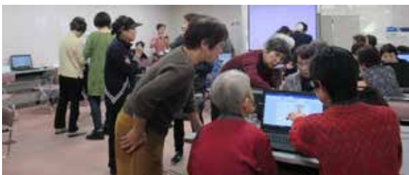
パソコンで作品を作成中♪

パソコン体験コーナーでは、カード、年賀状、シールのサンプルを用意し、来られた方が好みの作品を作り喜んで持ち帰りました。今年は特に親子の家族連れの協力作品もありました。14時半からはパソコンクラブの方々が工夫を凝らしたムービー作品7本を上映しました。皆、力作揃いで大変好評でした。先生方の呼び込みもあり、パソコン体験者40名、ムービー鑑賞者48名と大変盛況でした。例年フォーラムはパソコン連絡会【12の登録団体】の作品展示を通し、日頃の学習成果を発表する場になっております。また、他の団体との交流ができる場にもなり、有意義なフォーラムだと感じました。