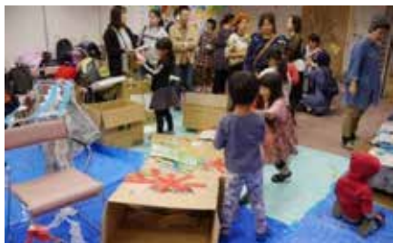
子どもたちの目が輝いていました

思いおもいにつくった作品を壁一面に貼ってもらったら、どこにもない、素敵なアート作品が最後になりました。参加者からは、「テレジンの子どもの作品も、子どもたちのキラキラした笑顔もすばらしかった」という感想をいただきました。