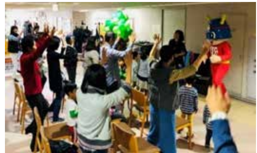
キュータ君とシナプソロジー四動作!

シナプソロジーで脳の活性化をしながら地震や火事の時のあるあるクイズに答えていただいたり、参加者の体験談を発表していただきながら、社会の見守りをしてくださっている消防署のお仕事を理解し、防災についての知識を学ぶ場となりました。昨年に引き続き2度目の試みでしたが、今回はキュータ君が登場したこともあってか、お子さんの参加が多く老若男女が和やかに交流できたのが微笑ましかったです。署長さんがどんな質問にも優しく対応してくださり、講座後は消防署がすっかり身近に感じられるようになりました。