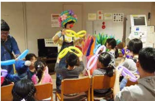
ちょっと怖いけど勇気を出してチャレンジ

参加者の皆様の様子を通して、バルーンアートは年齢性別関係なく取り組める内容であることを改めて実感することができ、今後の団体活動への意欲にもつながりました。