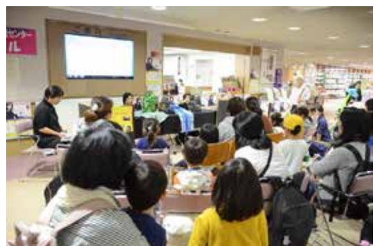
トルルなんてこわくないぞ

今回は、ミニミニシアター人形劇を上演させていただきました。メンバー手作りの人形で「3びきのやぎのガラガラドン」そして「北風と太陽」また、今回は体験型として、かえるのパペットを子どもたちに動かしてもらい、音楽に合わせて楽しみました。ロビー入口での上演で、沢山の方に見ていただき、私たちも楽しい時間となりました。今後も、より沢山の方に人形劇を楽しんでいただくために、練習していきたいと思えます。