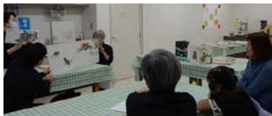
作品「おおきなかぶ」を読み聞かせ♪

初めて男女共同参画推進フォーラムでワークショップを開催しました。大型絵本、紙芝居を使って団体メンバー10人で「もちもちの木」や、パフォーマンスを入れた「どろぼうがっこう」など、いくつかの作品を披露しました。呼び込みのかいあって、たくさんの親子連れの方が参加されました。絵本の読み聞かせ以外にも、会場には子どもたちが手に取って読めるように絵本を15～16冊ほど用意しました。アンケートでは「来年も聴きに來ます」との感想もいただき、団体メンバーも感激でした。‘絵本の世界’の奥深さを老若男女の皆さんに体験していただきたかったので、とてもいい機会となりました。