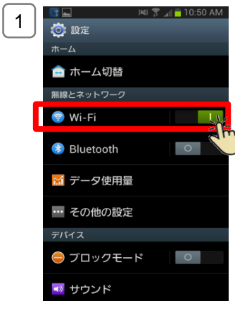
Wi-Fiの設定をONにし、有効にする