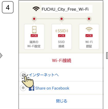
上記画面が表示されたらインターネット接続が完了 (「インターネットへ」をタップするとブラウザが起動し、リダイレクト先HPが表示されます)