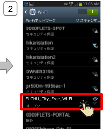
「FUCHU_City_Free_Wi-Fi」または「FUCHU_City_Free_Wi-Fi_Plus」を選択して接続