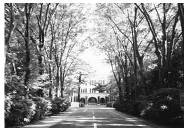
5 とうきょうのこうだいがく 東京農工大学