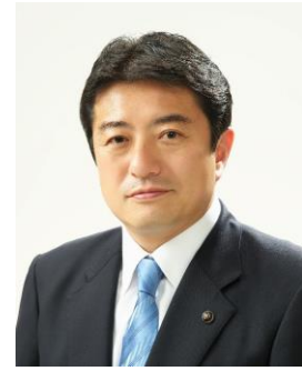
府中市長 高野 律雄

本市では、平成26年度を初年度とする第6次府中市総合計画を、市民の皆様と協力し、ともにまちづくりを進めていく「協働」を基軸として策定し、目指す都市像「みんなで創る 笑顔あふれる 住みよいまち」の実現に向けて、市政の計画的・総合的な推進に努めております。