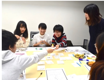
考えたアイデアを出し合う