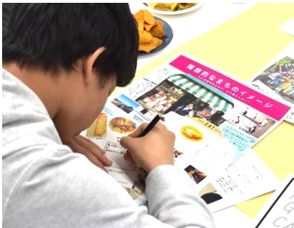
理想のまちのイメージから...

地域の課題を解決したり、魅力を生かしているか(Needs)、自分がやりたいもしくは参加したいことか(will, wish)、自分も少し関われそうか(can)が重なると実現可能な面白い企画が生まれます。