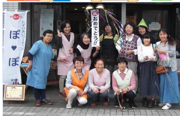
地域の居場所・コミュニティカフェ オープン