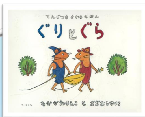
『てんじつき さわるえほん ぐりとぐら』 中川李枝子作 大村百合子絵 福音館書店