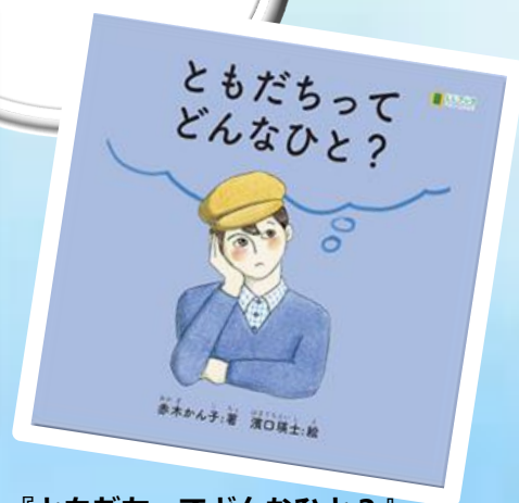
『ともだちってどんなひと?』 赤木かん子作 濱口瑛士絵 埼玉福祉会