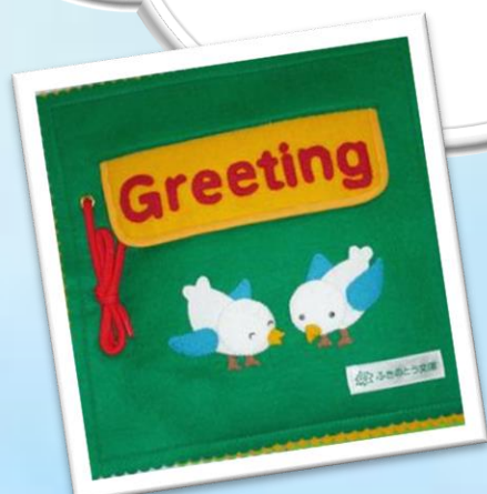
『Greeting』 ふきのとう文庫、ちくちく製作

図書館で貸出を行っていますのでご利用ください。予約および団体・学校への貸出も可能です。