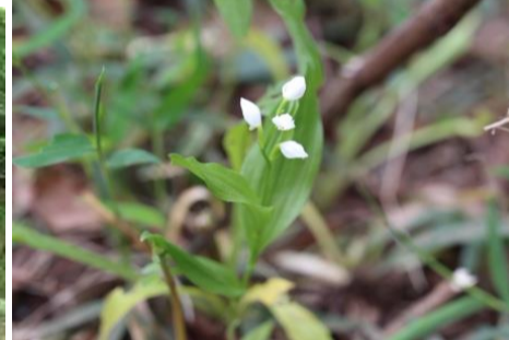
ギンラン 絶滅危惧IB類