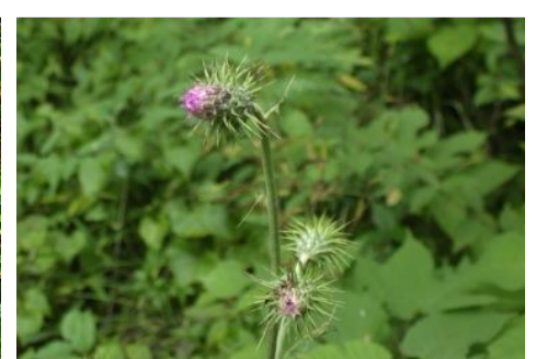
トネアザミ (タイアザミ)