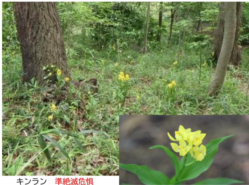
キンラン 準絶滅危惧