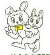
ビョン太 と ミミちゃん