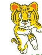
トラちゃん 四谷文化センター