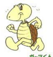
ガッツくん 武蔵台文化センター