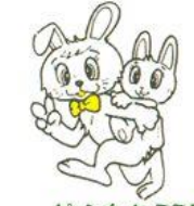
ビョンホとミミちゃん 西府文化センター