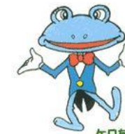
ケロちゃん 是政文化センター