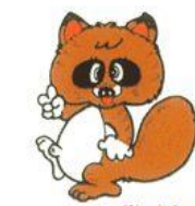
ボンタちゃん 押立文化センター