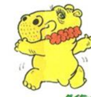
ダイちゃん 白糸台文化センター