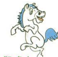
ポニーちゃん 片町文化センター