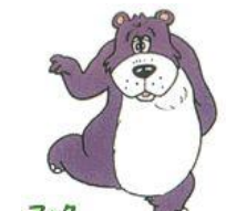
マック 新町文化センター