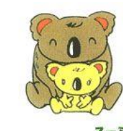
スーミン 住吉文化センター