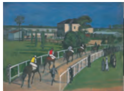
中西利雄《府中競馬場》1934年 | 当館蔵

府中市の二大スポット、東京競馬場と馬場大門のケヤキ並木。その歴史と景観を絵画作品でたどります。