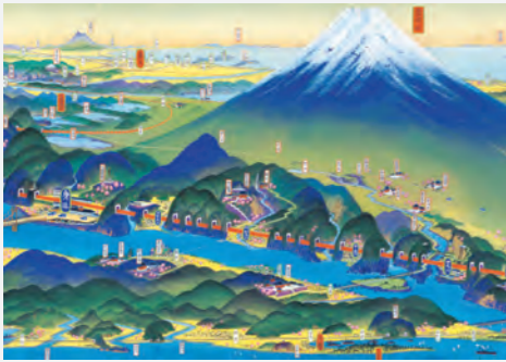
吉田初三郎《富士身延鉄道沿線名鳥瞰図》(部分) 1928年

From the Taisho to prewar Showa era, YOSHIDA Hatsusaburo (1884-1955) depicted views of various parts of Japan overlooked from the sky. His bird's-eye views commanding panoramas of extensive ranges by means of unique deformation are depicted in detail. Feeling as if traveling within his pictures, one never gets tired of looking at them. With large-scale hand-painted bird's-eye views at the core, the world of Yoshida Hatsusaburo unfolded in various mediums such as paintings and posters is introduced.