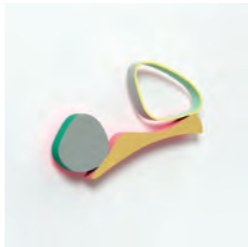
小木曾瑞枝《音飛び(25.NOV.2021)》2022年 | OGISO Mizue, Record Player Skipping (25 Nov. 2021) , 2022

Ogiso combines colors and forms with discerning taste to create landscapes overflowing with warmth and poesy. Note the thorough process through which she turns commonplace materials into works.