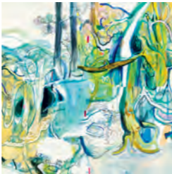
手嶋遥《山行き》2022年 | TESHIMA Haruka, Going to the Mountain , 2022

This Japanese-style painter walks around a single place making small sketches and depicts the landscape by weaving in time and space. She will make a painting of a “mountain” near the museum.