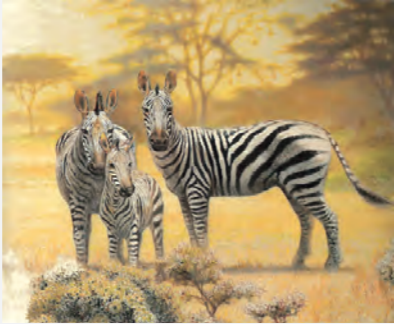
吉田遠志《シマウマ》1978年 | 個人蔵 YOSHIDA Toshi, Zebras , 1978, private collection

吉田遠志(1911-1995)の父は明治の天才画家吉田博、母は画家ふじを、弟は版画家の穂高です。一家は吉田ファミリーとして全米をめぐり木版画を普及しました。幼い頃からの動物園スケッチは、ついにアフリカの大草原へと続いていきました。遠志の独自の動物観察眼は自然の側におかれ、動物がわれわれ人間を凝視するかのようです。本展は画家吉田遠志の初回顧展となります。