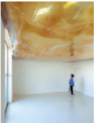
鵜飼美紀《The World in Between》2021年 | gallery21yo-jでの展示風景 UKAI Miki, The World in Between , 2021 | View of a display at gallery21yo-j

Fascinated by latex (natural rubber), Ukai has been using her materials and the space all the more daringly in recent years. Come and feel the power that motivates this artist in person.