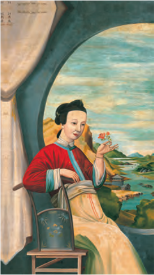
司馬江漢《円窓唐美人図》江戸時代中期(18世紀)|当館蔵 SHIBA Kokan, Chinese Beauty by a Circular Window , mid-Edo period (18th C.), Fuchu Art Museum

江漢と田善は、江戸時代に油絵や銅版画を手がけた洋風画家です。風雅を愛する文人だった江漢と、西洋の技術にのめり込んで「ものづくり」に熱中した田善。二人の作品の特徴は異なりますが、共通して感じられるのは、遠近法への素直な驚きから生まれた造形の「かっこよさ」でしょう。二人の持ち味の違いにも注目しつつ、洋風画の魅力に迫る展覧会です。