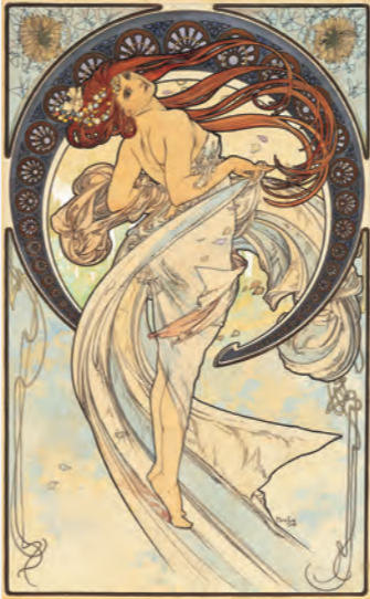
アルフォンス・ミュシャ《ダンス》(連作「四芸術」より)原画 1898年 | サントリーポスターコレクション(大阪中之島美術館寄託) Alphonse Mucha, Dance , drawing 1898, Suntory Poster Collection (deposited in Nakanoshima Museum of Art, Osaka)

A designer who created numerous posters, which added flair to fin-de-siècle Paris, and an artist who depicted grandiose themes as substantial oil paintings. Alphonse Mucha (1860-1939) has been regarded as an artist with two faces. However, the consistent feature of both phases is the overwhelming creativity he applied to produce a style of his own regardless of the material. Here, the greatest appeal of this artist, his ability to make forms, is unraveled through his prints, oil paintings, and rare sketches.