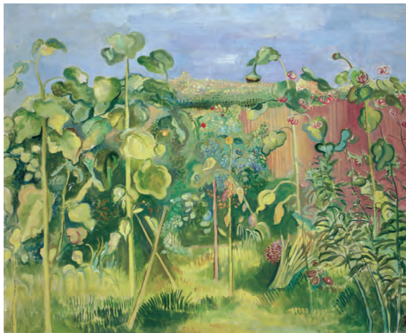
牧野虎雄「向日葵の園」1929年(昭和4) | 当館蔵 MAKINO Torao, Garden of Sunflowers , 1929, Fuchu Art Museum