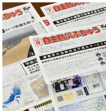
防災情報誌「自主防災ふちゅう」

災害時に、市の職員が市民の皆さん一人ひとりを 助けに行くことは出来ません。 災害が発生したら自分はどう行動すべきか、災害を 自分事として捉え、備えていただくために、防災の知識や その重要性を市民の皆さんにお伝えしています。