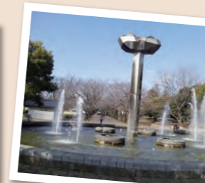
都立府中の森公園