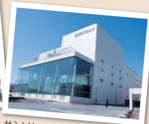
サントリー武蔵野ビール工場