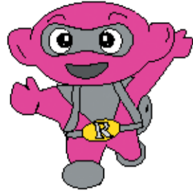
▲府中市のリサイクルマスコット リサちゃん