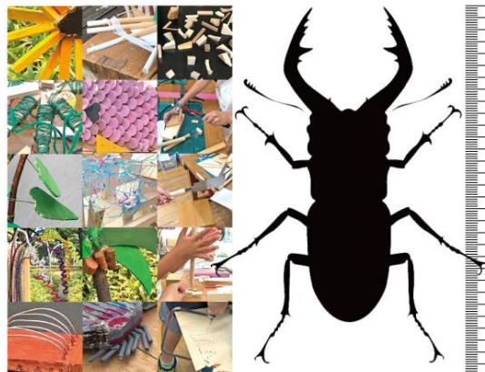
細かい部分まで作りこんでみよう!

申込方法 7月20日(火)まで(当日消印有効)に、往復はがき(1人1枚)に住所、氏名(ふりがな)、学年、電話番号、希望日、返信用宛名を記入して、当館「自由工房」係へ https://www.city.fuchu.tokyo.jp/art/event_artstudio/events/art_studio/art_studio_2021/20210812jiyukobo.html