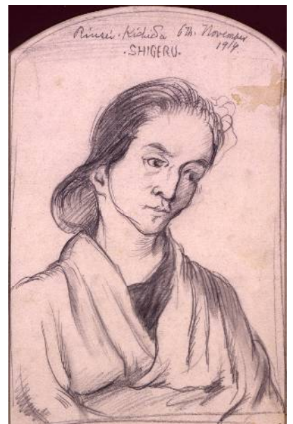
岸田劉生《葵の像》1914年、鉛筆・紙